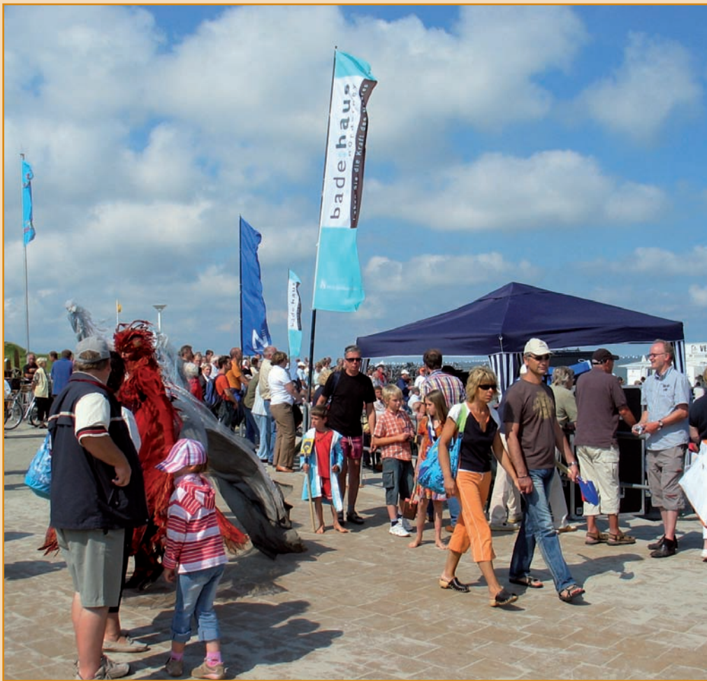
Gut besucht: Das Promenadenfest 2007