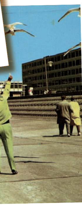
Es war in den 60er Jahren, als die Dame mit dem apfelgrünen Freizeitanzug auf der Promenade Möwen fütterte. Aus der aufgesetzten Mauer ist, gut im Hintergrund zu erkennen, eine zweite Stufe des Deckwerks geworden. Dreieckige Betonsteine sollten den Schwung der bei Sturmflut anrollenden Wellen brechen.