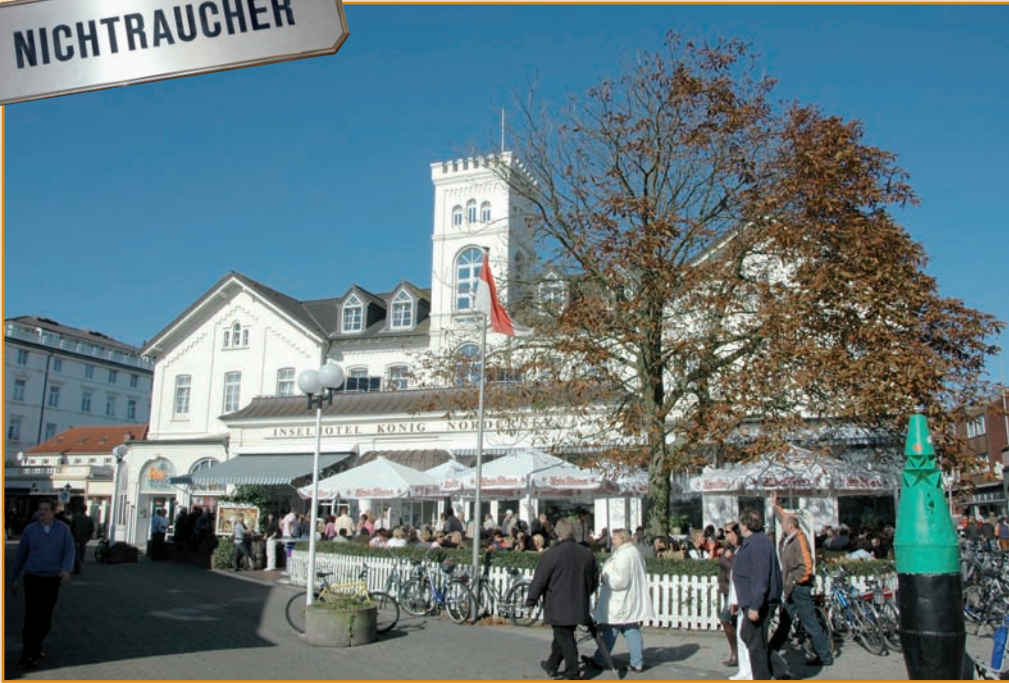
Nicht betroffen vom Rauchverbot, die gemütliche Sonnenterrasse vor dem Inselhotel König