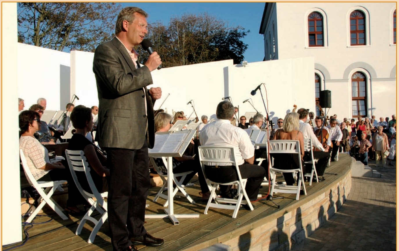
Ministerpräsident Christian Wulff weihte den neugestalteten Kurplatz ein