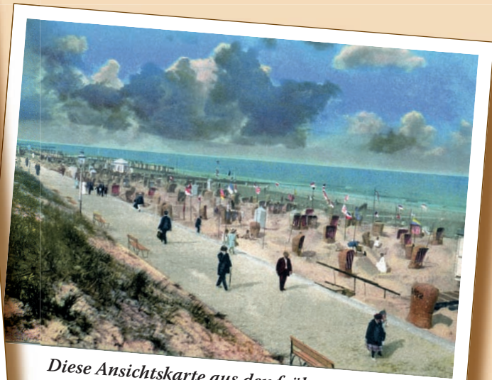
Diese Ansichtskarte aus den frühen 20er Jahren des vergangenen Jahrhunderts zeigt dieselbe Stelle. Mittlerweile ist dort das erste feste Deckwerk mit S-Profil entstanden.