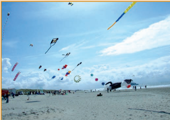
Wunderbar farbenfroh präsentiert sich der Himmel zum Drachenfest am Weststrand

In diesem Jahr war unser Gastro-Team unter anderem beim Hochspringmeeting auf dem Kurplatz mit dabei. Besonderer Höhepunkt des Jahres 2007 war wohl das Promenadenfest.