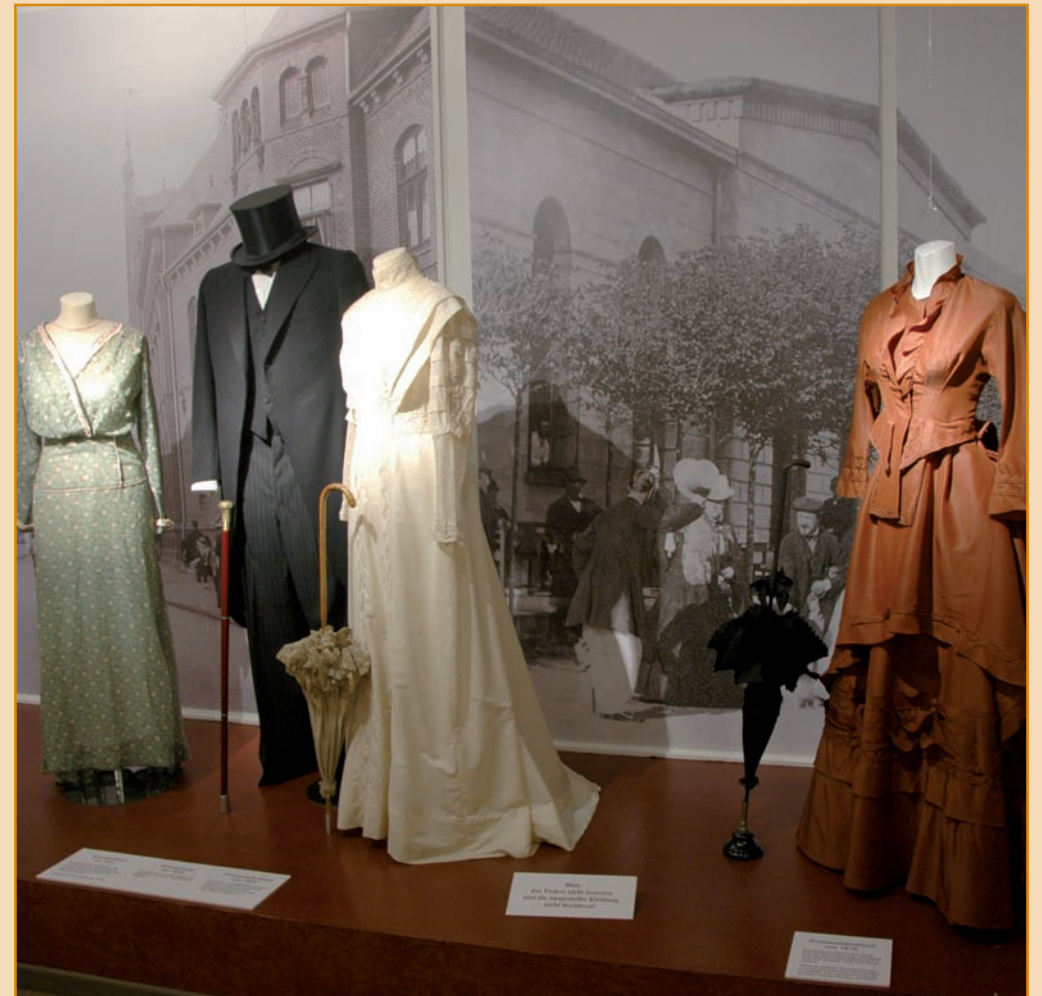
Sehenswerte Ausstellung im „bade-museum“ am Weststrand

ständen wird Geschichte greifbar gemacht. Zudem wird das Museum durch wechselnde Ausstellungen angereichert, sodass sich auch das Wiederkommen lohnt.