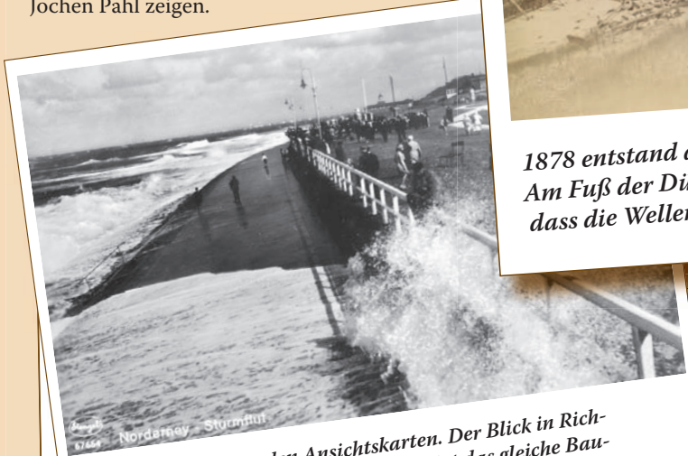
Ein Klassiker unter den Ansichtskarten. Der Blick in Richtung Georgshöhe in den 30er Jahren zeigt das gleiche Bauwerk. Mittlerweile ist eine Mauer darauf gesetzt worden.